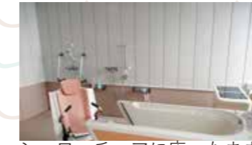
シャワーチェアに座ったまま入浴できる機械浴

今後も利用者様に寄り添い、環境面の整備やケアの質の向上につとめ、満足していただける通所リハビリテーション事業所を目指していきたいと思っています。