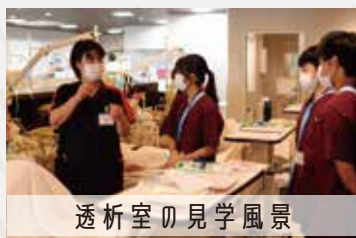
透析室の見学風景