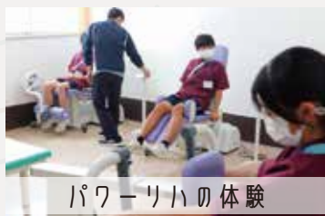
パワーリハの体験