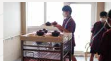
病棟での食事介助の体験